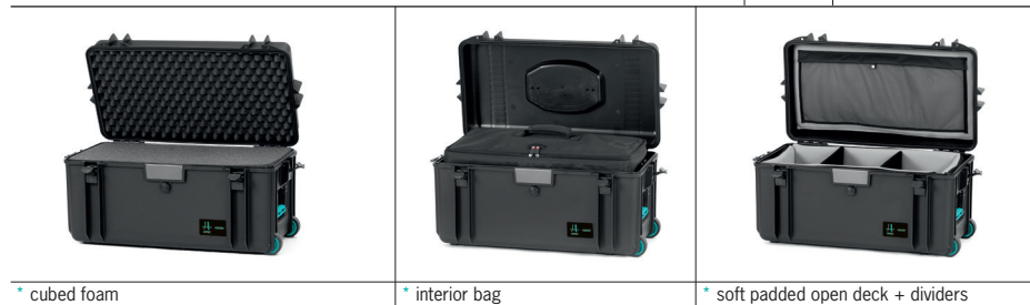
* cubed foam