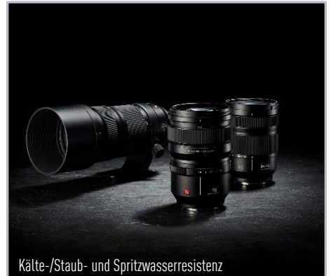
Kälte-/Staub- und Spritzwasserresistenz