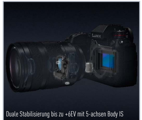
Duale Stabilisierung bis zu +6EV mit 5-achsen Body IS