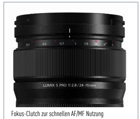
Fokus-Clutch zur schnellen AF/MF Nutzung