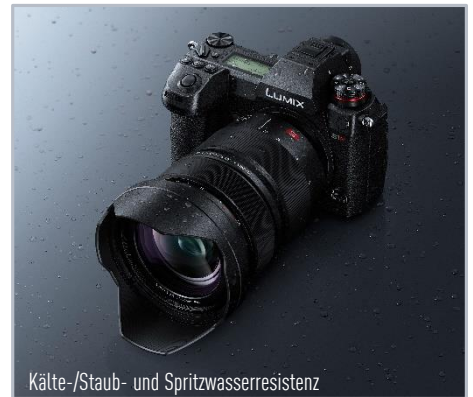
Kälte-/Staub- und Spritzwasserresistenz