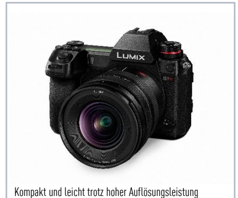
Kompakt und leicht trotz hoher Auflösungsleistung