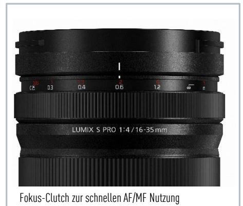
Fokus-Clutch zur schnellen AF/MF Nutzung