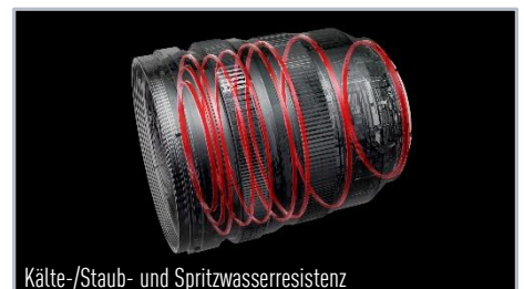
Kälte-/Staub- und Spritzwasserresistenz

S-R1635E | EAN 5025232910274 | UVP: 1.599,00€