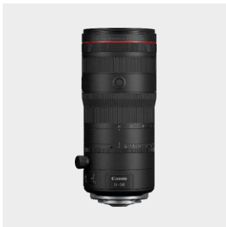
RF 24-105mm F2.8 L IS USM Z